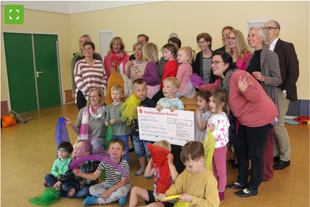
Eine Stiftung der Bocholter Stadtsparkasse fördert das Projekt mit 5000 Euro