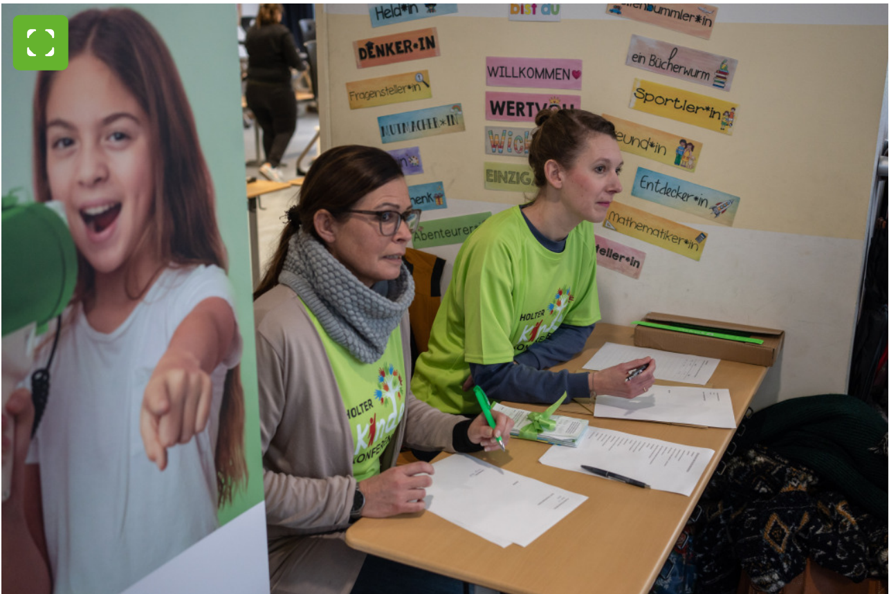
Die Wünsche der Schülerinnen und Schüler werden durch Mitarbeiterinnen des Fachbereichs Jugend, Familie, Schule und Sport aufgenommen.