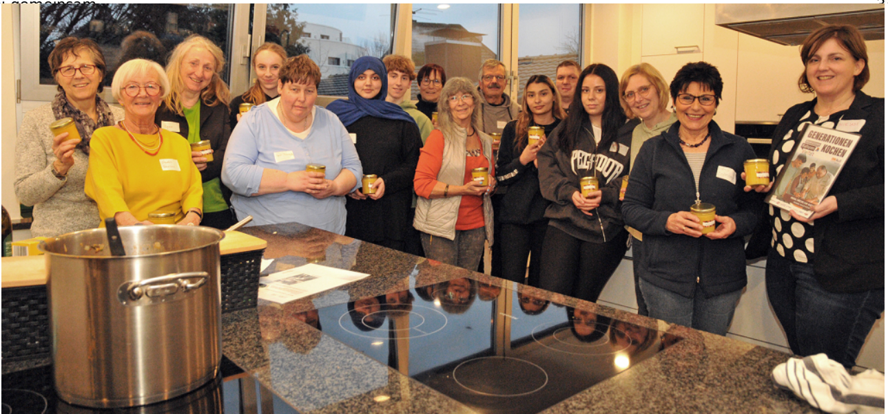
Gemeinsames Tun, gemeinsam ins Gespräch kommen, voneinander lernen! Darum ging es beim dritten Generationenkochen in der Fabi..., und um Olivenöl