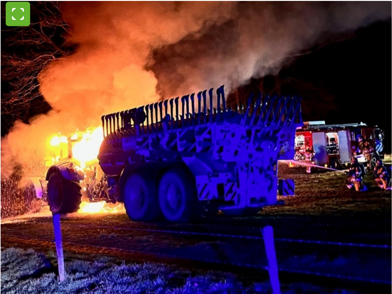
Brennender Traktor wird durch die niederländische Brandweer gelöscht.