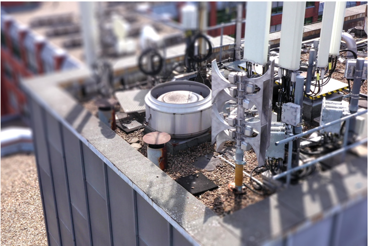
Alle Alarmsirenen in NRW werden am Donnerstag ab 11 Uhr aufheulen