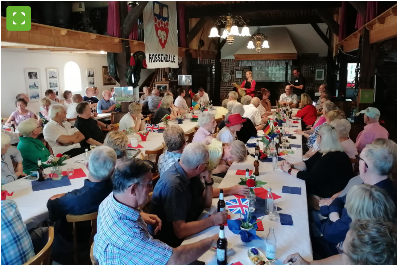
Zahlreiche Mitglieder und Gäste beim 40-jährigen Jubiläum der Deutsch-Britischen Gesellschaft Bocholt e.V. im Heimathaus Mussum am 9. September 2023