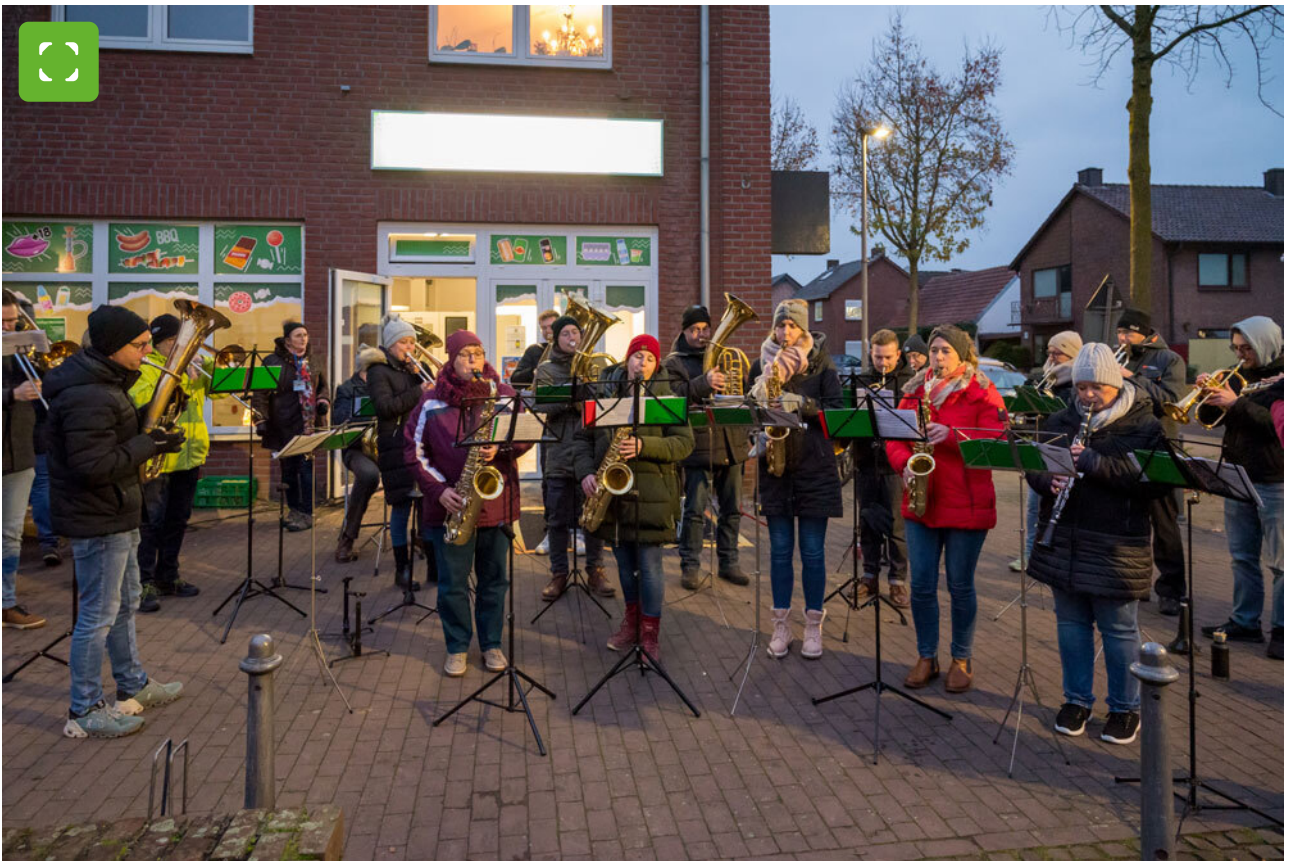
Musikalisch wurde die Veranstaltung vom Isselburger Blasorchester und den niederländischen Mittwinter-Bläsern umrahmt