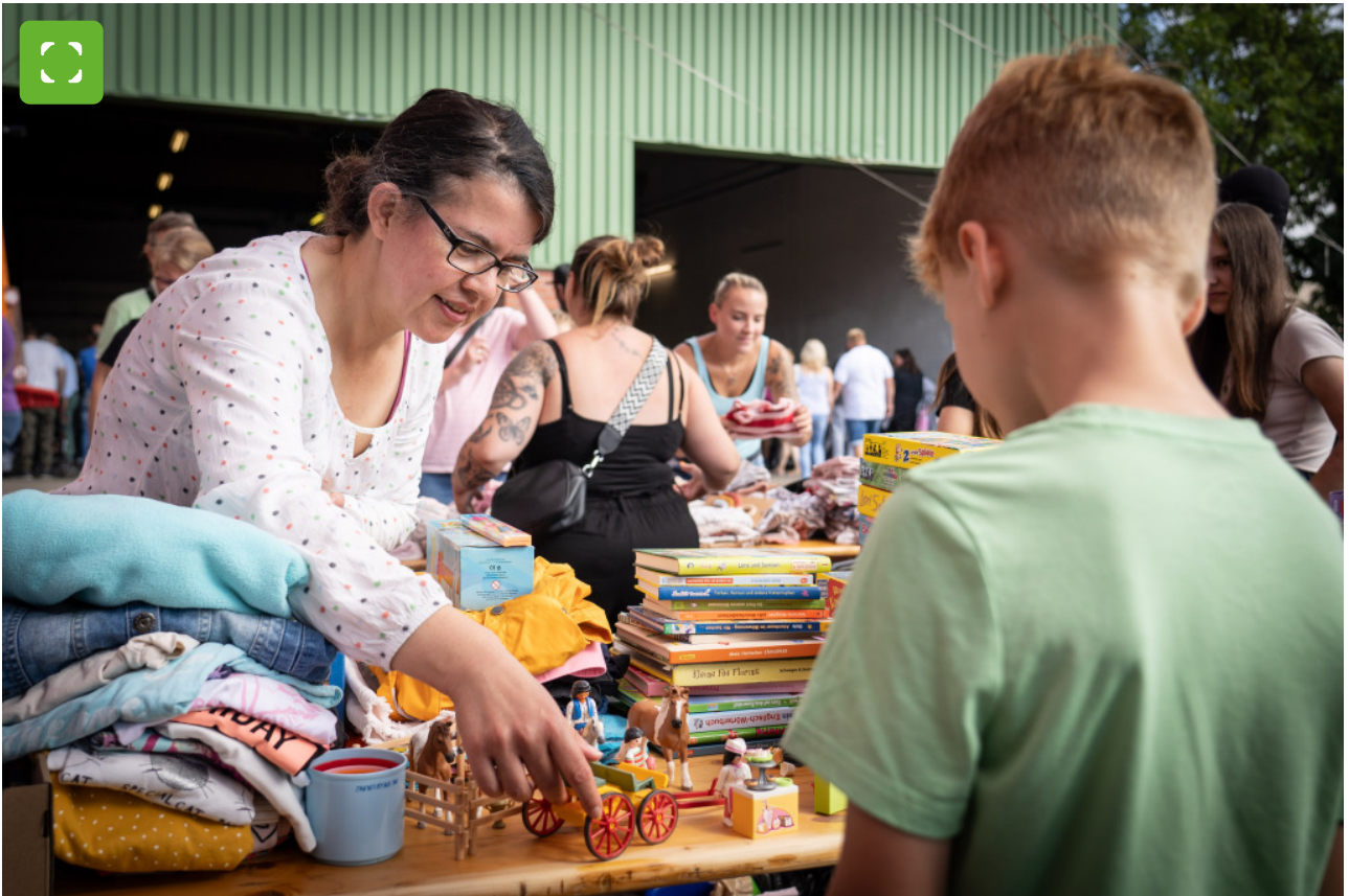
An den Ständen gab es neben Kinderkleidung auch viele gebrauchte Spielsachen