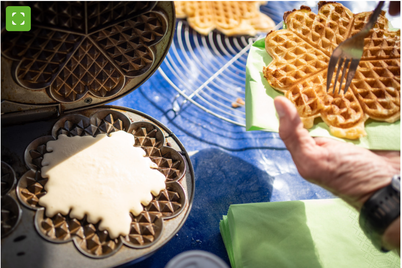
Allein 480 Waffeln gingen beim Kinderflohmarkt über die Kuchentheke