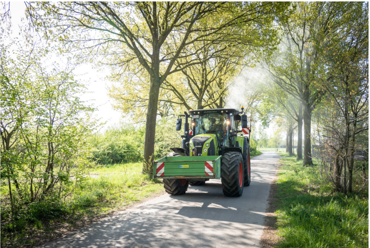
Mitarbeiterinnen und Mitarbeiter des Entsorgungs- und Servicebetriebs besprühen die Eichen in den Außenbezirken.