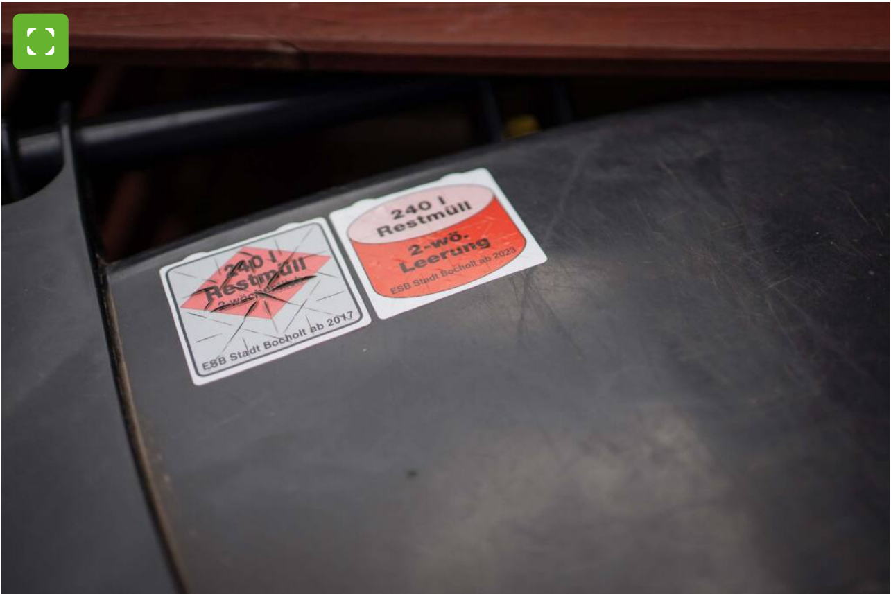
Auch die 240-Liter-Restmülltonne bekommt eine neue Plakette (rechts)