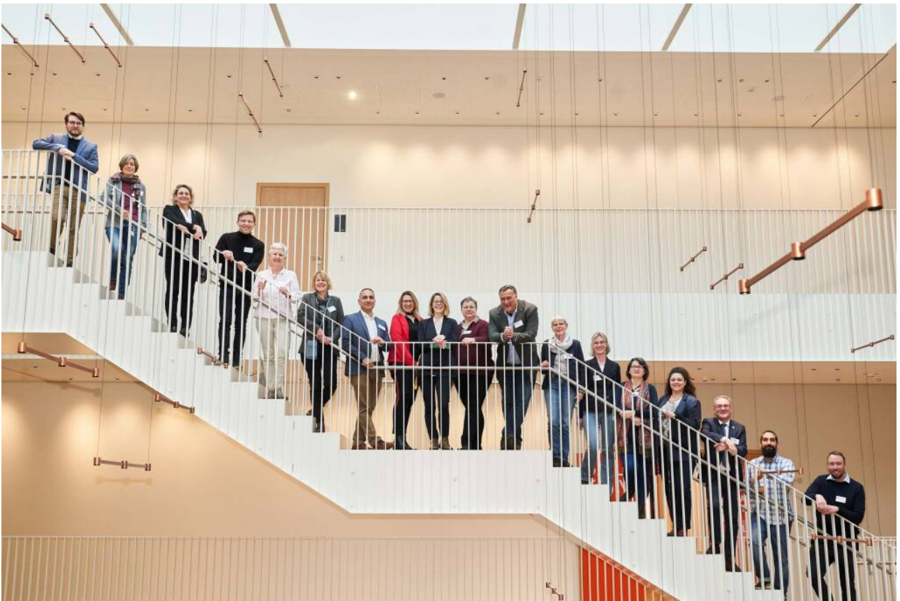
In den Stadtlabors treffen sich Vertreterinnen und Vertreter aus 15 Städten in Deutschland