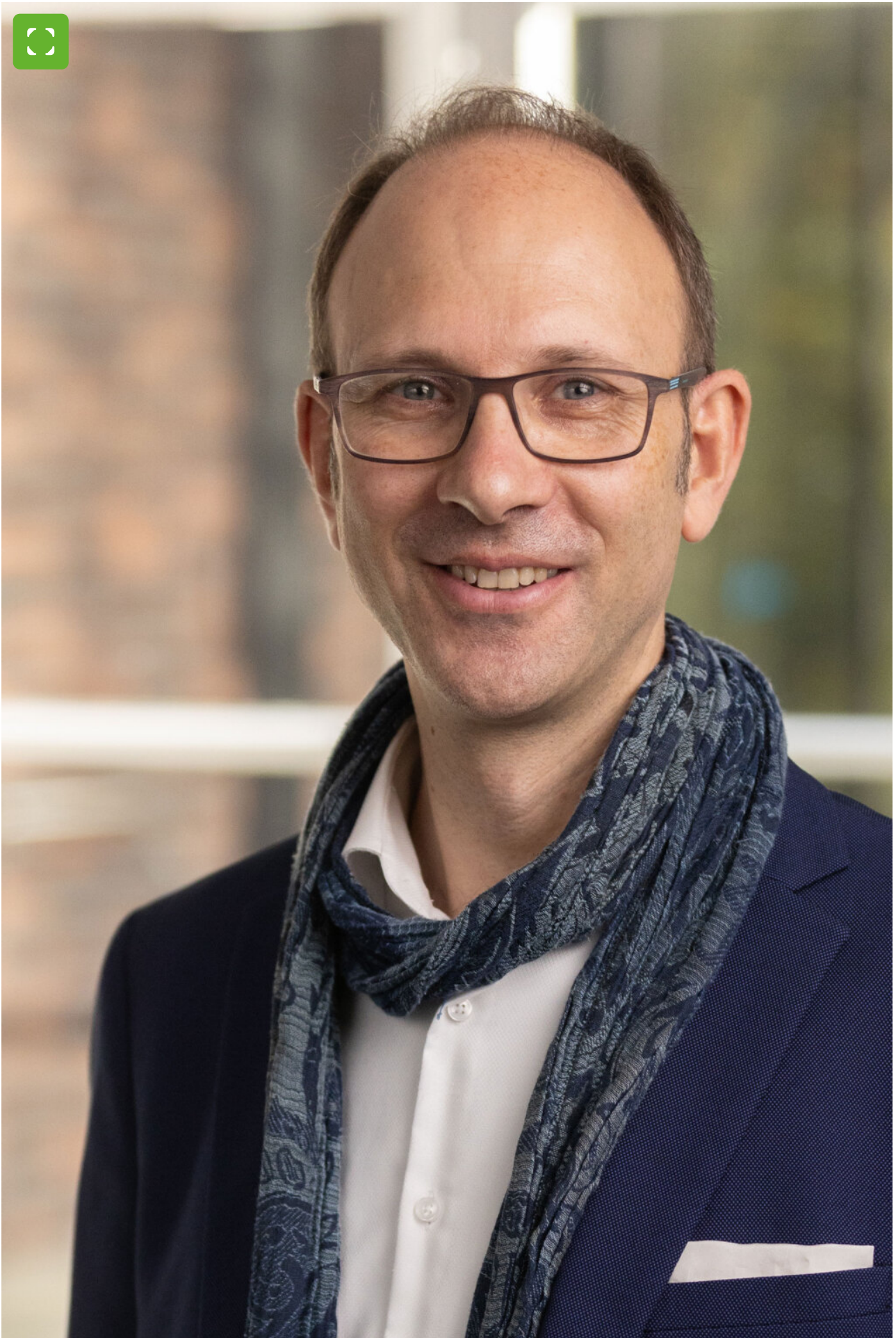
Stadt Bocholt - Der Bürgermeister Kaiser-Wilhelm-Straße 52-58, 46395 Bocholt www.bocholt.de Instagram: @stadt.bocholt | Facebook: fb.com/stadt.bocholt