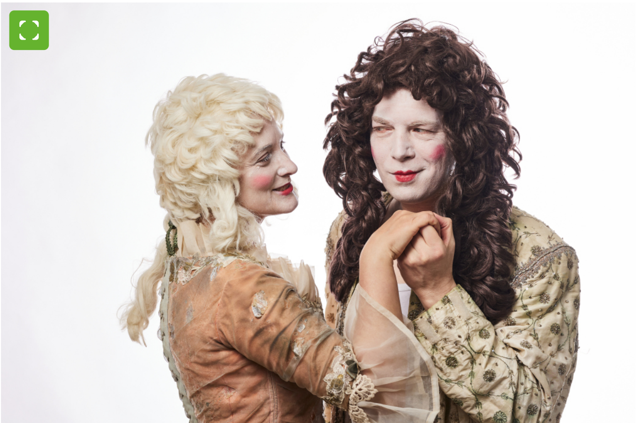
Mann und Frau in Kostümen und mit Perücken, die sich angucken