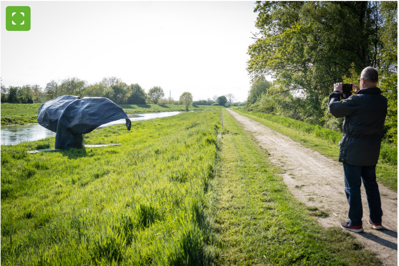
Die Walfluken werden bis zum 1. Juni in Bocholt zu sehen sein