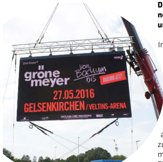
Leinwand zum Open Air mit Herbert Grönemeyer