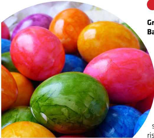
Ostern in der City