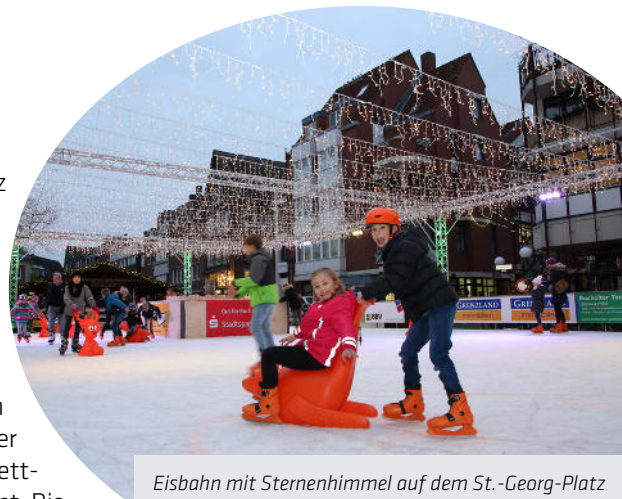
Eisbahn mit Sternenhimmel auf dem St.-Georg-Platz