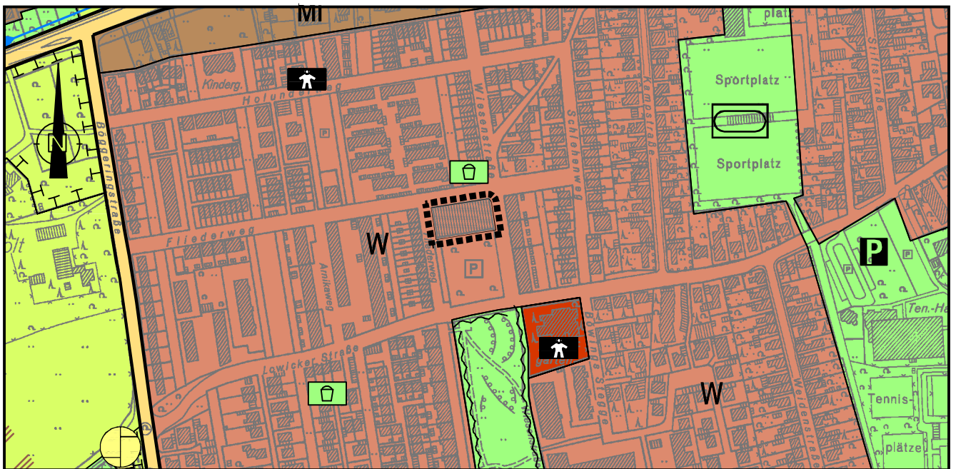
Auszug aus dem rechtsverbindlichen Flächennutzungsplan