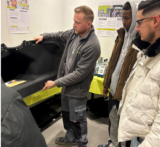
Nacht der Ausbildung ►

Der Fachkräftemangel stellt die Unternehmen vor große Herausforderungen. Um Ihnen bei der Suche nach den passenden Fachkräften zu helfen, bekommen Sie hier verschiedene Projekte und Veranstaltungsformate vorgestellt, die sich in und um Bocholt etabliert haben, erfolgreich waren / sind oder ganz neu angeboten werden.