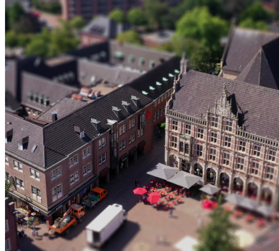
Service Onboarding@Münsterland ►