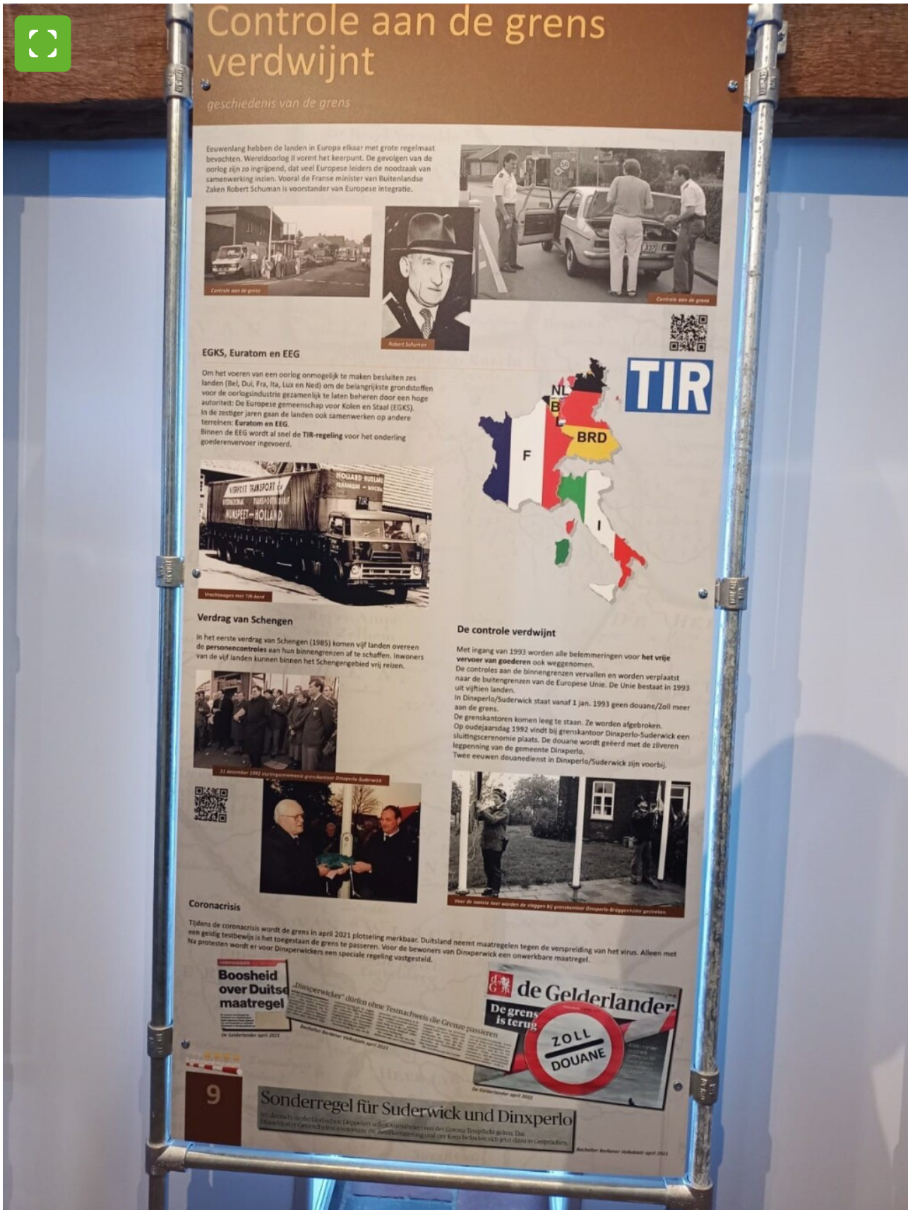
The Borderland Museum also features a summary of EU history with the founding of the EU Single Market and the exemptions for border residents during the Corona Crisis.