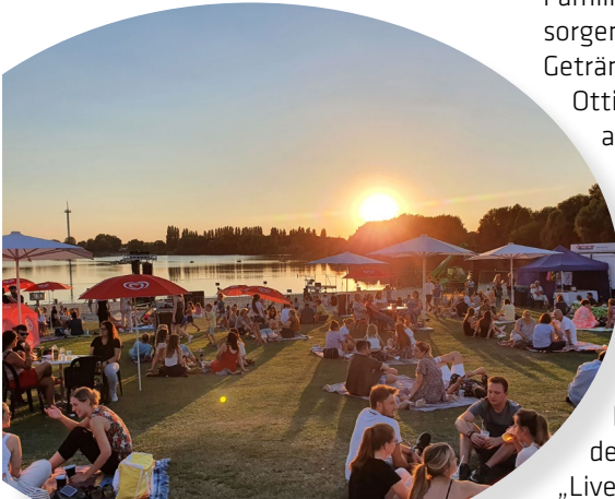
Aasee-Festival an der Badebucht

Nach dem erfolgreichen Highlight im vergangenen Jubiläumsjahr, wird es auch in diesem Sommer ein Aasee-Festival an der