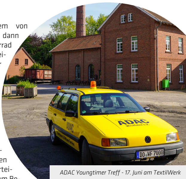
ADAC Youngtimer Treff - 17. Juni am TextilWerk

senswertem und Kulturellem von Bocholt bekommen. Alle, die dann noch vom Auto auf das Fahrrad umsteigen wollten, bekamen einen Flyer des Bocholter Aa-Radwegs. - Hoch wird auch die Teilnehmeranzahl bei der NRW Radtour sein. Diese beliebte Tour findet vom 29. Juni bis 2. Juli statt und startet in Wesel am Aasee. Bocholt ist der erste Pausenort am LWL-Museum Textilwerk. Dort wird die Tourist-Info einen Stand aufbauen und Informationsmaterial verteilen. Drei gute Gelegenheiten, um Besucherinnen und Besucher auf Bocholt aufmerksam zu machen und so Kunden und neue Touristen zu akquirieren.