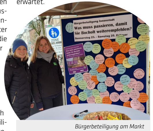
Bürgerbeteiligung am Markt

Maßnahmen werden im Spätsommer erwartet.