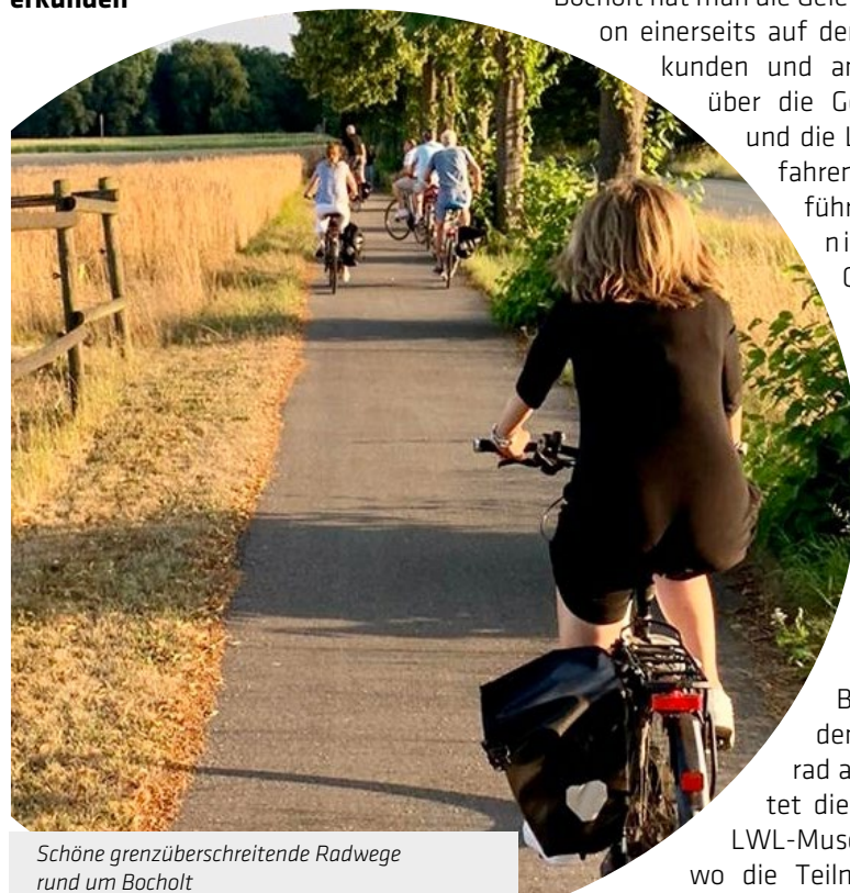
Schöne grenzüberschreitende Radwege rund um Bocholt

Auf einer geführten Radtour rund um Bocholt hat man die Gelegenheit, die Region einerseits auf dem Fahrrad zu erkunden und andererseits mehr über die Geschichte, Kultur und die Landschaft zu erfahren. Die Radtour führt in das deutsch-niederländische Grenzgebiet: In das westliche Münsterland und den niederländischen Achterhoek. Ein ortskundiger Guide hält dabei Informationen und Geschichten über die Grenzstadt Bocholt bereit. Mit dem eigenen Fahrrad ausgestattet startet die Tour jeweils am LWL-Museum Textilwerk, wo die Teilnehmerinnen und