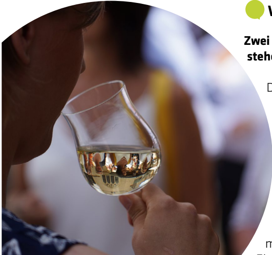
Weinfest: 21. - 23. Juli auf dem St.-Georg-Platz