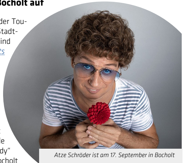
Atze Schröder ist am 17. September in Bocholt

Atze Schröder ist seit März 2022 wieder auf Tournee und hat dabei bemerkt, wie sehr er die Bühne und seine Fans vermisst hat. Ergänzend zu den Nachholterminen 2023 hat er deshalb eine Reihe von Zusatzshows terminiert. Mit „Echte Gefühle“ bringt die lebende Legende und der „King of Comedy“ dabei sein Erfolgsprogramm in Bocholt auf die Bühne. Am 17. September wird ab 18.00 Uhr Atze Schröder da sein – ein tolles Event für die Bocholterinnen und Bocholter. Die Veranstaltung ist ausverkauft.