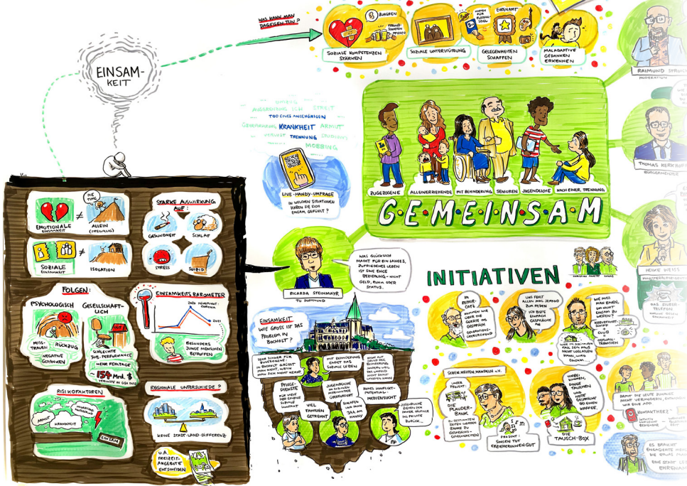
Mit dem Stift festgehalten: Michael Tewieles Blick auf den Abend