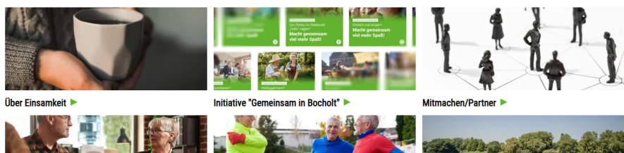
Über Einsamkeit ▶

Diese Seite will über Einsamkeit informieren, von deutschlandweiten Zahlen bis hin zu konkreten Angeboten gegen Einsamkeit in Bocholt. Denn wir sind überzeugt: Wir alle können etwas gegen Einsamkeit tun! Wir können mit anderen Menschen offen über das Alleinsein sprechen, wir können uns austauschen, welche Angebote es gibt und wir können dazu aufmuntern, Angebote aufzusuchen oder sie auch einfach gemeinsam besuchen.