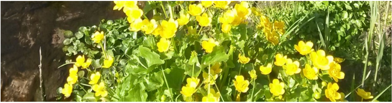
Extensiv gepflegte Grünanlagen Büssinghook / Bömkesgraben

Vor dem Hintergrund der dramatischen Abnahme der Biodiversität haben Land und Kommunen eine Handlungsstrategie entwickelt. Bocholt ist, mit dem Ziel der Verbesserung der Biodiversität, Mitglied am Runden Tisch des Kreises Borken zur Erhaltung der Artenvielfalt.