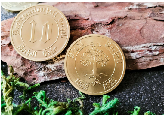
Bocholt Taler ▶