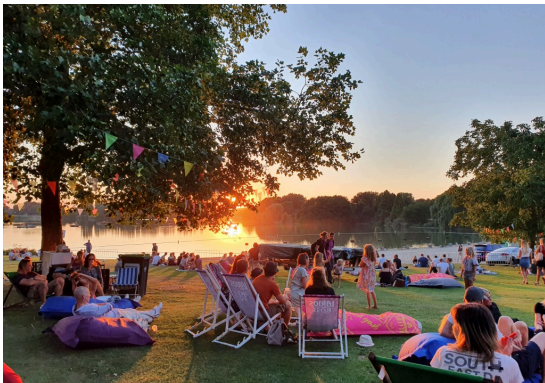
Erleben und Entdecken ▶