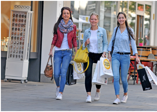
Shopping in Bocholt ▶