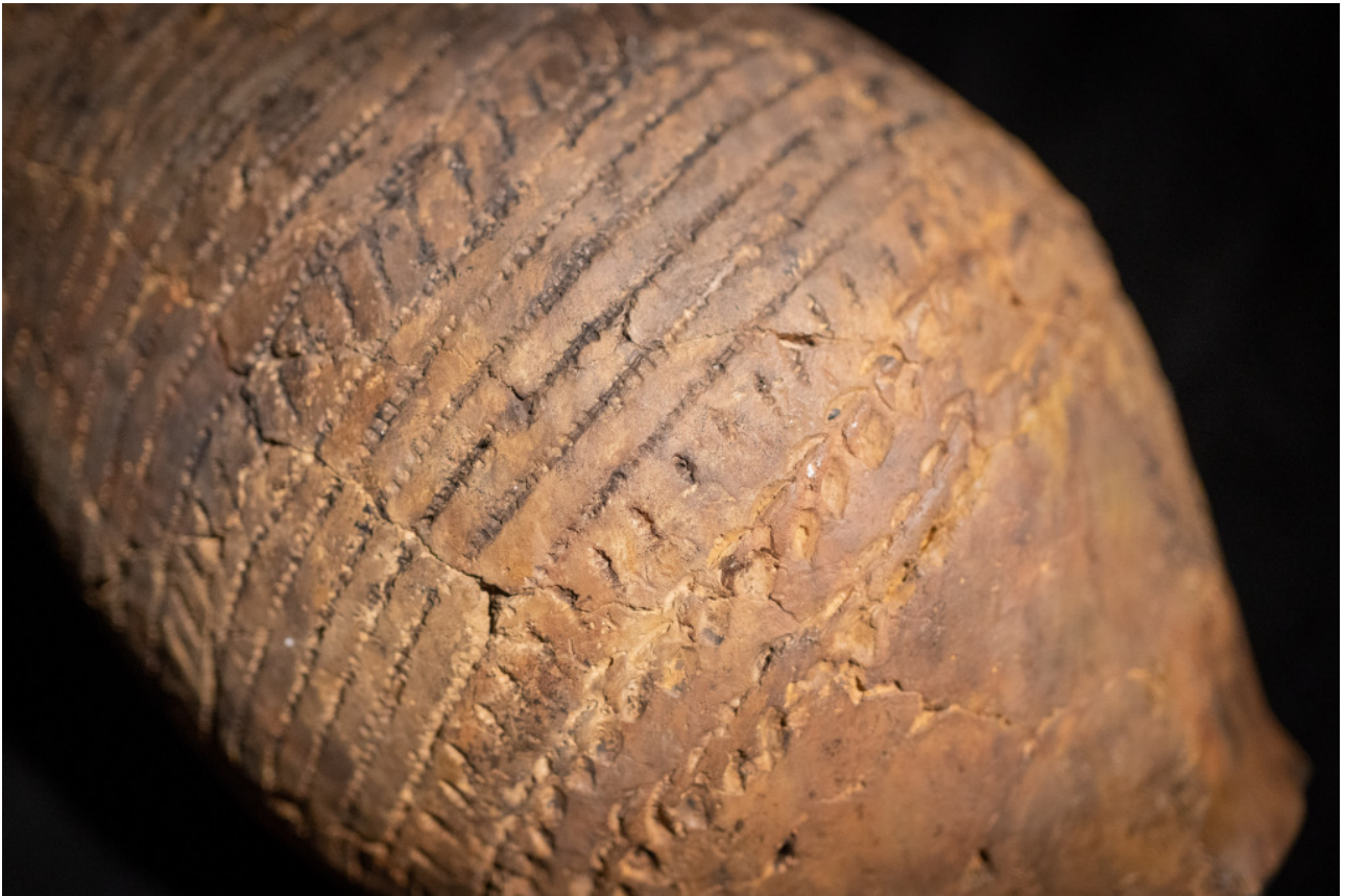
Historische Stücke der Stadtgeschichte sind im Stadtmuseum ausgestellt.