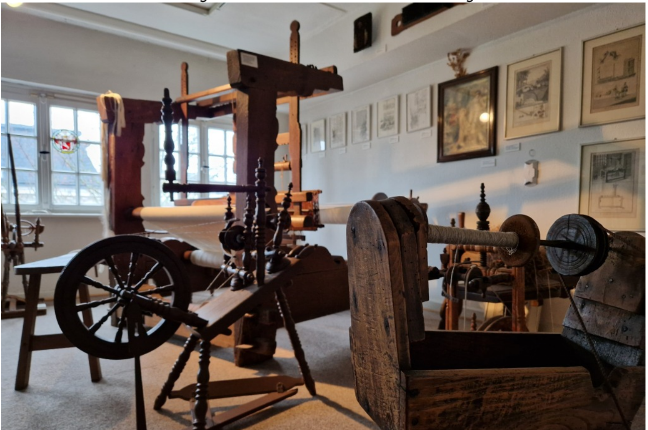
Textil-Handwerk hat in Bocholt eine lange Tradition.