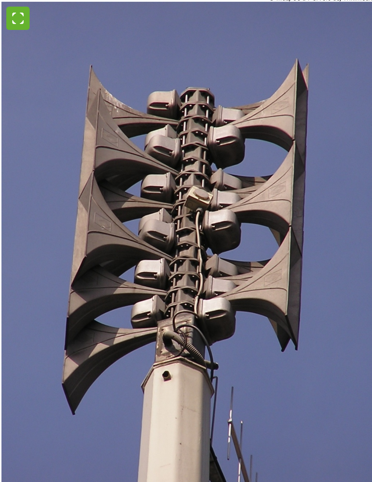
Voorbeeld van een elektronische sirene