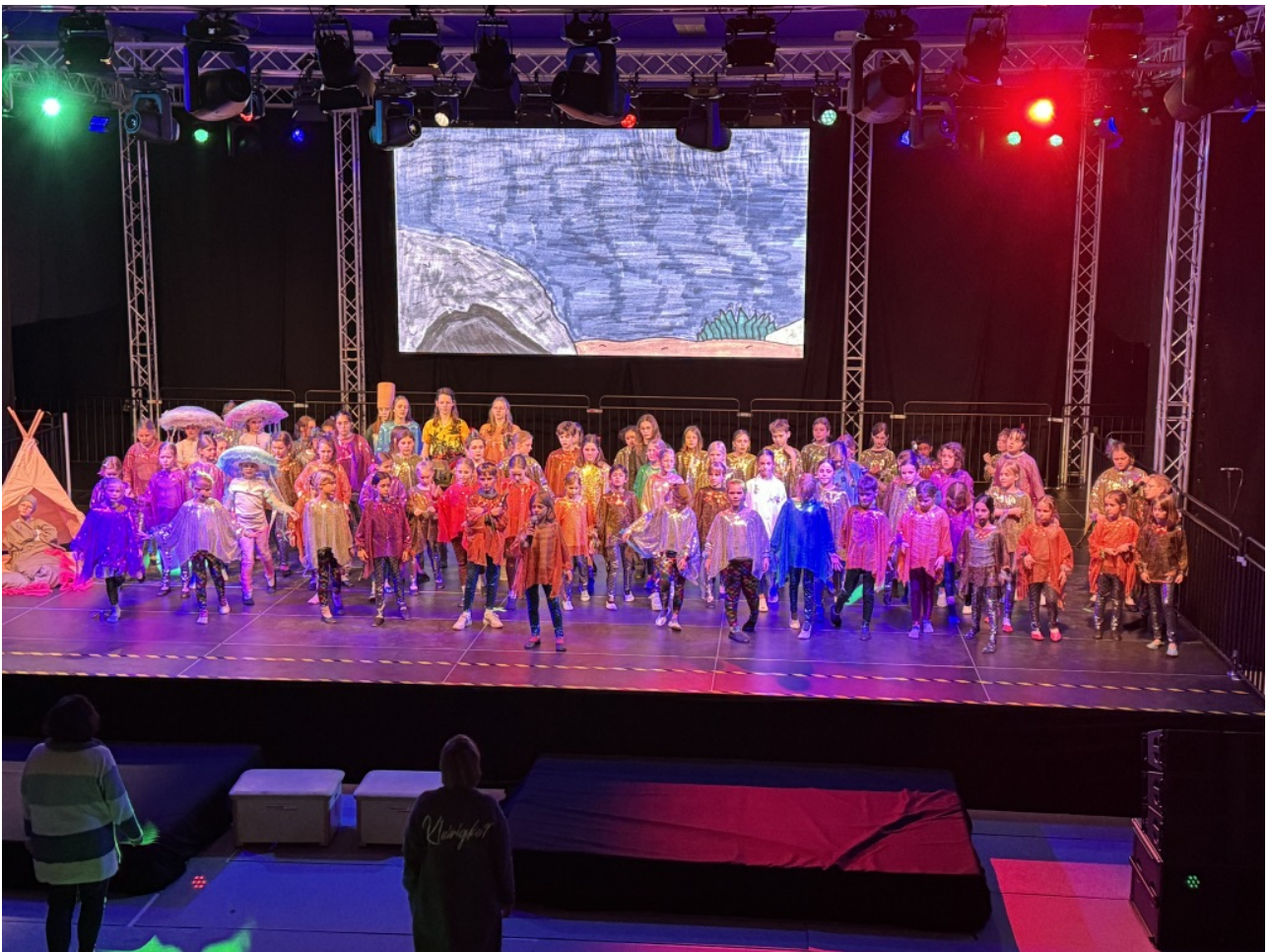
Generalprobe des Kindermusicals