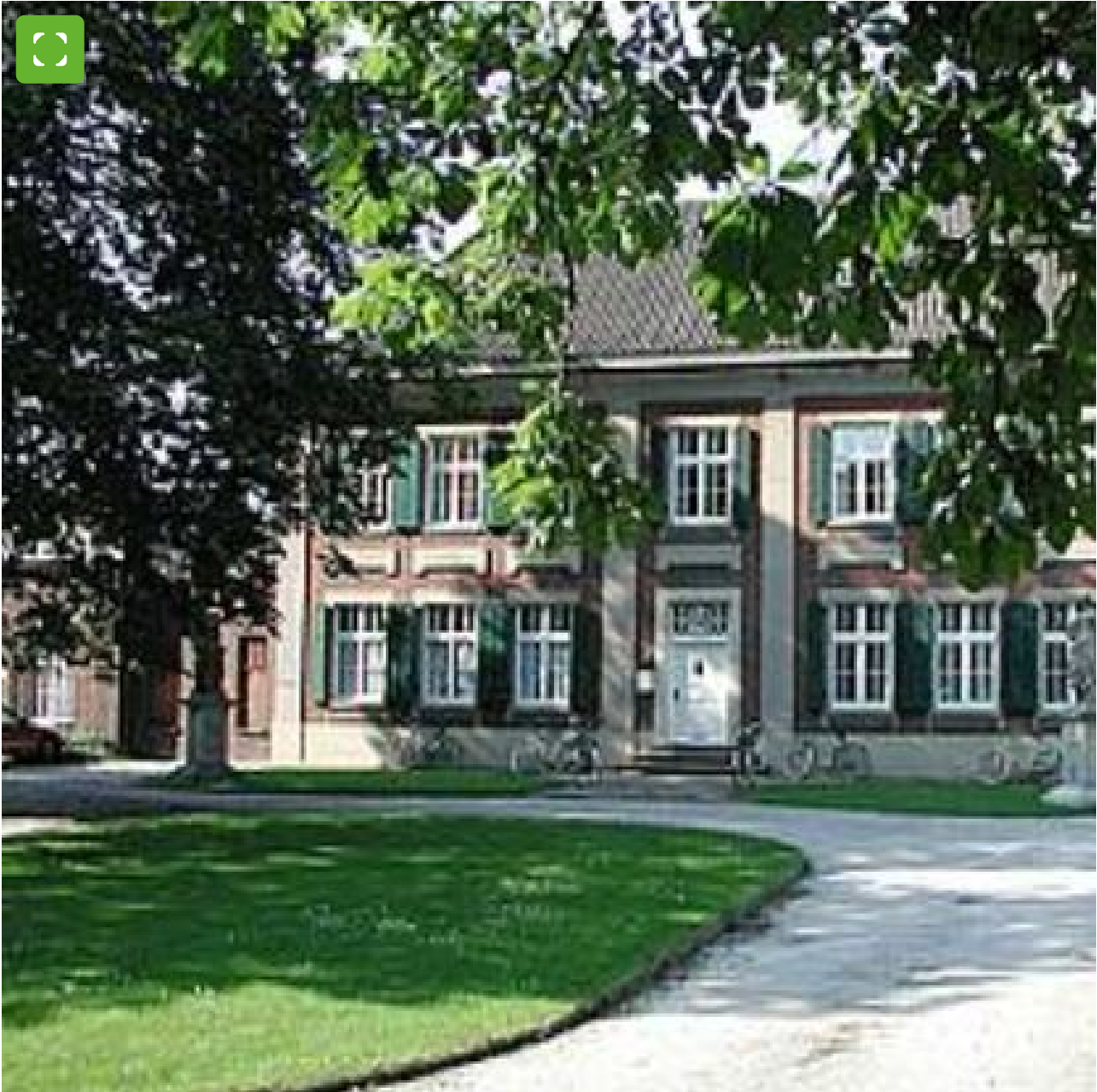
Herrenhaus Woord Bocholt

Das Herrenhaus Woord wurde 1792 bis 1795 erbaut. Es steht auf der Münsterstraße 13. Das zweigeschossige Herrenhaus besteht aus Ziegel- und Werkstein mit Walmdach. Es wurde 1934 erweitert. Nach Kriegszerstörung wurden das Herrenhaus in alter, die Nebengebäude in veränderter Form wieder hergestellt.