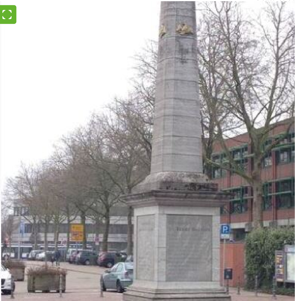
Obelisk auf Berliner Platz in Bocholt

Der Obelisk vor dem Rathaus am Berliner Platz ist die Nachbildung eines preußischen Meilensteines auf dem Berliner Platz, erbaut 1985. Von seinem Standort sind es 470 km nach Berlin. Der Berliner Platz war lange Zeit ein "Symbol des Nachkriegsstädtebaus" und war insoweit vom nüchternen Wiederaufbau geprägt.