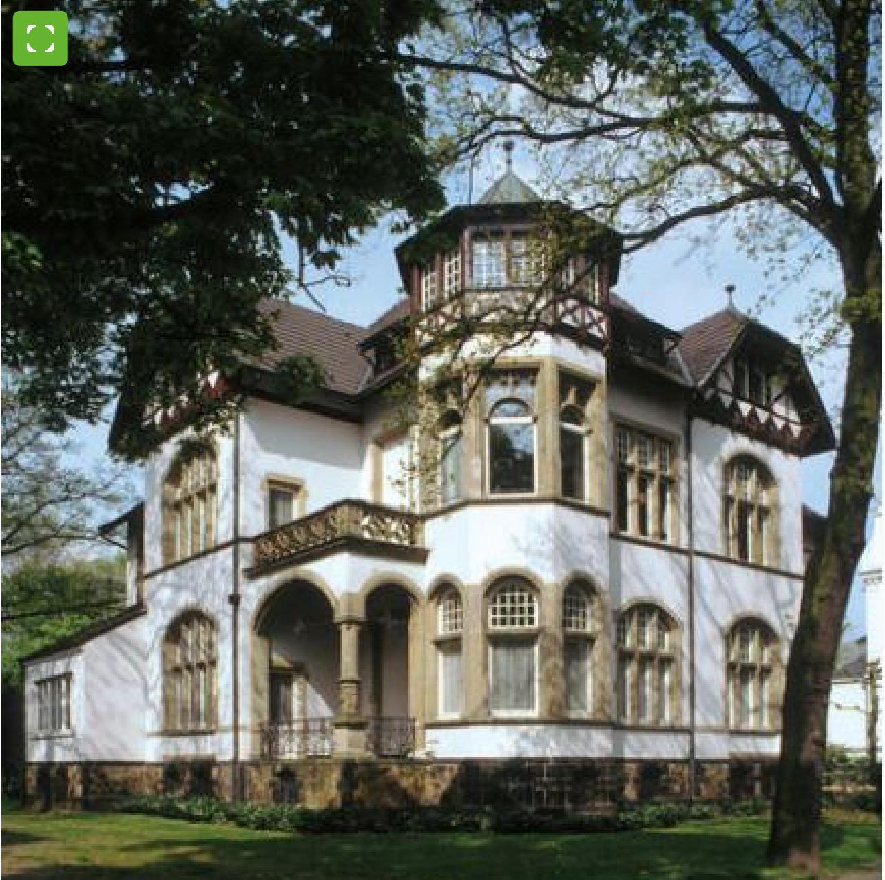
Bürgerhaus Salierstraße in Bocholt

Ein historisch interessantes Gebäude aus dem Jugendstil steht auf der Salierstraße 6, erbaut etwa um 1900. Heute ist dort die Musikschule der Städte Bocholt und Isselburg untergebracht.