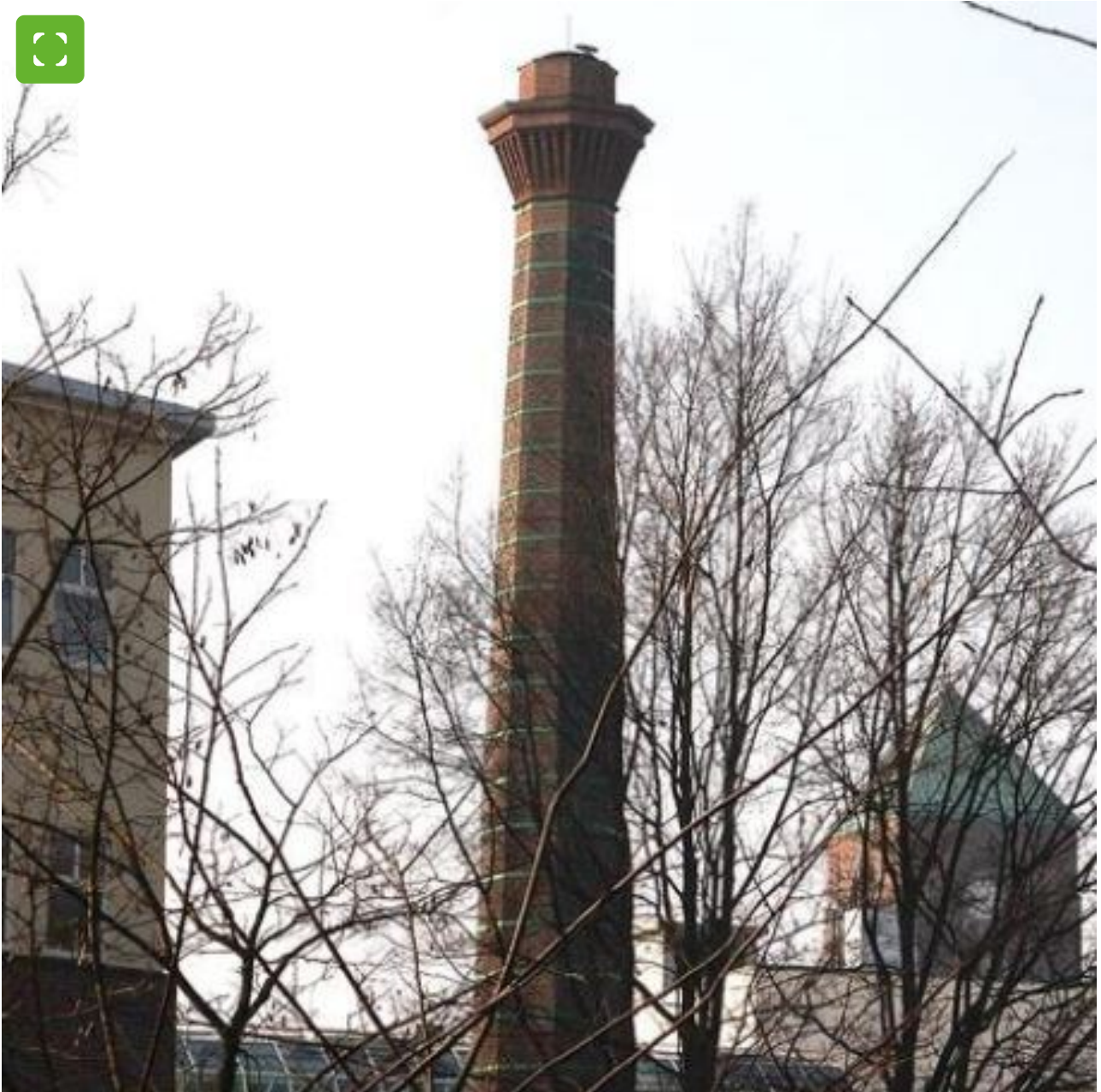
Historischer Mauerwerksschornstein in Bocholt

Der Mauerwerksschornstein ist ein Industriedenkmal in Nähe der Shopping-Arkaden. Das 32 Meter hohe Relikt aus dem Jahre 1857, dem Zeitalter der Industrialisierung, ist in achteckiger Form mit Eisenbändern auf quadratischem Sockel erbaut.