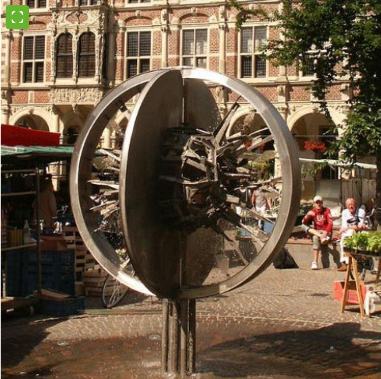
Europa-Brunnen in Bocholt

Bocholt wurde 1972 die Ehrenbezeichnung "Gemeinde Europas" verliehen, es folgten die Europafahnen und die Bezeichnung "Europastadt". Die Verleihung des Titels war Anlass für die Erstellung des Europa-Brunnens vor dem Historischen Rathaus. Künstler Friederich Werthmann entwarf die Stahlplastik zur 750-Jahrfeier. Zur Darstellung benutzt er eine Kugel in durchbrochener Form. Symbolisiert werden die Weltkugel, die Erdscheibe und der Sonnenring.