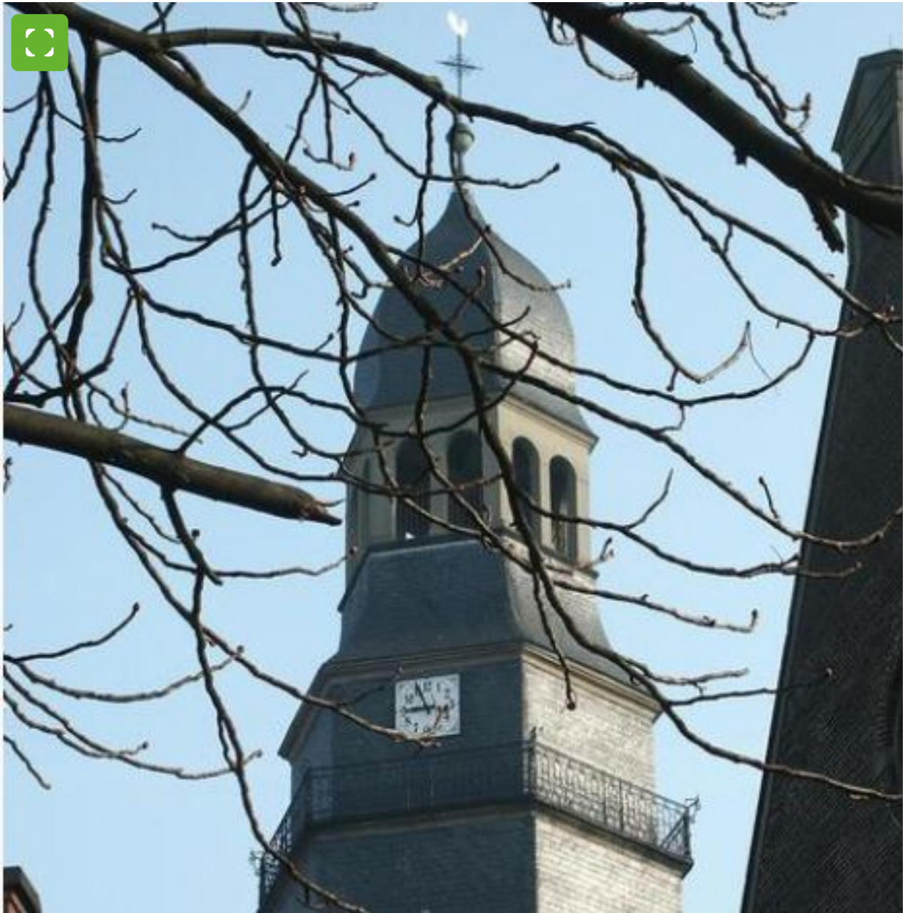
Pfarrkirche Liebfrauen Bocholt

Die Pfarrkirche Liebfrauen ist eine katholische Pfarrkirche, ehemals Klosterkirche der Minoriten, erbaut 1785 bis 1792, im spätbarocken Stil. Baulich erweitert wurde die Kirche 1912 bis 1913. Nach der Stadtkirche St. Georg wurde die Liebfrauenkirche um 1310 als zweite Pfarrkirche der Stadt geplant. Der Bau wurde 1316 vollendet.