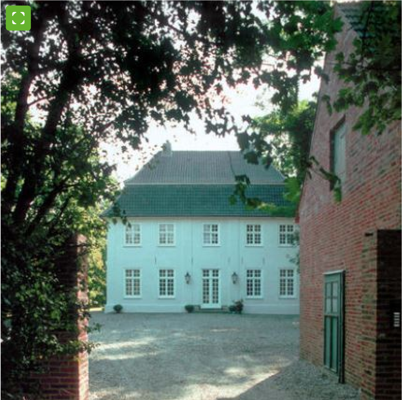
Herrenhaus Efing Bocholt

Das Herrenhaus Efing (Kornbusch) liegt nordwestlich der Stadt. Es ist ein zweigeschossiges Herrenhaus, bez. 1665 und 1965, mit hohem Mansarddach. An der Hauptfront steht ein kräftiger achteckiger Treppenturm. Inzwischen ist das Haus von Wohnsiedlungen umgeben.