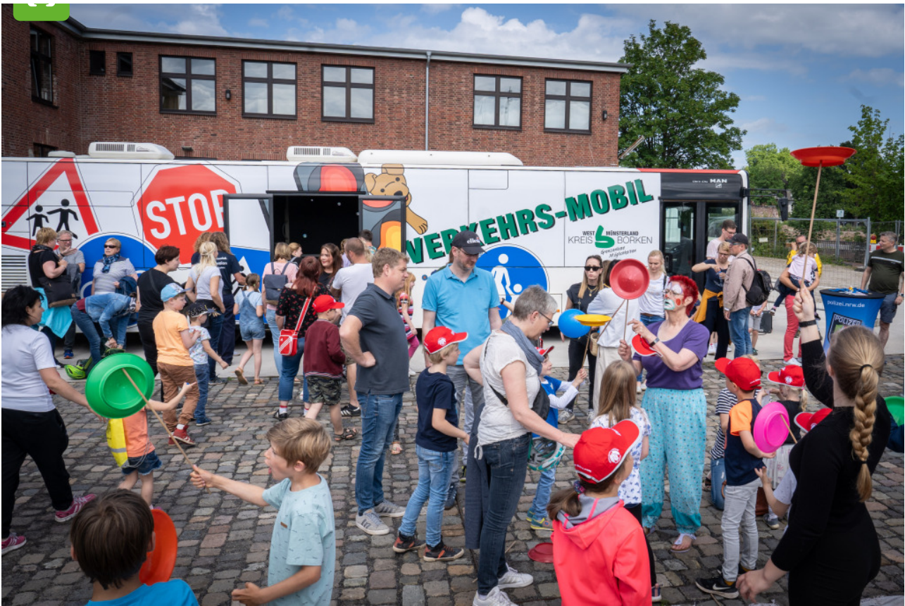
Beim großen Verkehrssicherheitstag gibt es Aktionen rund um die Sicherheit im Straßenverkehr