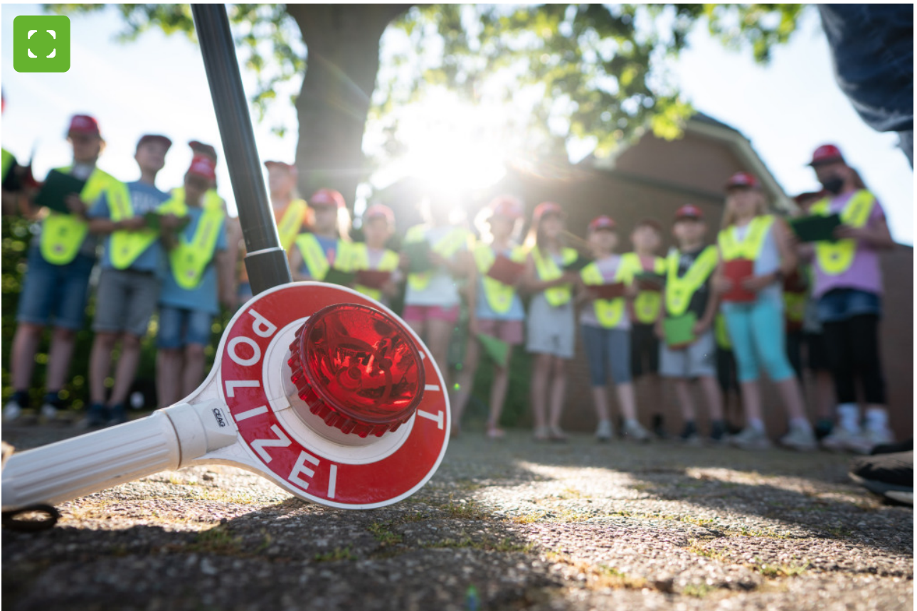
Bei den Anhalteaktionen gibt's Dank- und Denkwzettel für Autofahrerinnen und Autofahrer...