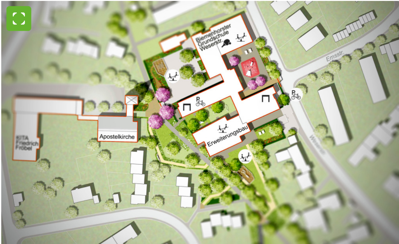
Die Biemenhorster Grundschule (Weserstraße)